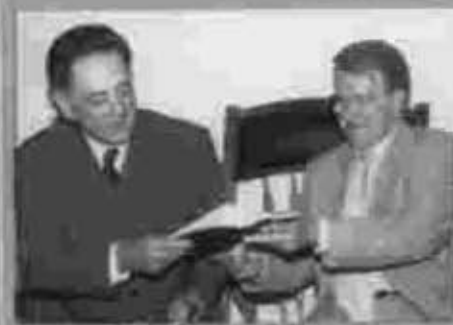
O presidente Quielse Crisóstomo da Silva entrega ao prefeito Nelson Juba as contas de 1998.

A Assembleia Legislativa colocou em pauta todas as prestações de contas dos governantes anteriores que se encontram paralisadas naquele poder, conforme determinação da Lei de Organização do Poder Judiciário. A informação foi prestada pelo